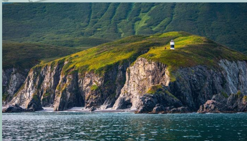
Победитель номинации «Выше облаков»